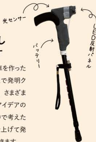
今年の青森県発明くふう展で入賞した「自動点灯杖」

小学校1年生の時に段ボールで車を作ったことで物作りに興味が湧き、3年生で発明クラブに入りました。クラブの魅力は、さまざまな事柄を物理的に体験しながら、アイデアの実現に結び付けていくこと。頭の中で考えたアイデアを試行錯誤しながら形に仕上げ発表し、そして次の発明に着手していきます。