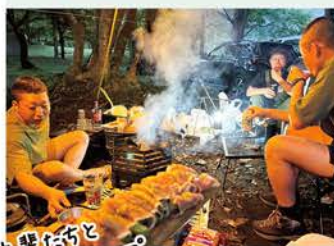
先輩後輩と 七戸でキャンプ

先輩や後輩と食事に行ったり、地元の友達と遊んだりしてリフレッシュしています。趣味はスケボーなどたくさん。普段は駐屯地内の隊舎で生活していますが、同部屋の後輩たちとも仲が良く、まるで合宿のようで楽しいです。