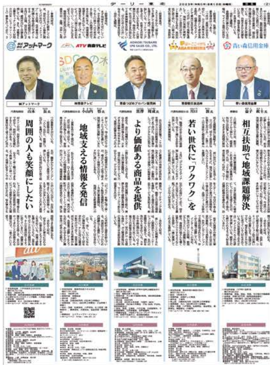
企業トップのインタビューを掲載した特集紙面の一部

青い森信用金庫/青森朝日放送株式会社/青森つばめプロパン販売株式会社/株式会社青森テレビ/株式会社アットマーク/株式会社あべはんグループ/株式会社一条工務店/エスプロモ株式会社/エプソンアトミックス株式会社/エム・ビー・エム・オペレーション株式会社/小幡建設工業株式会社/株式会社オリエンタルファーム/北日本造船株式会社/株式会社共同物流サービス/旭光通信システム株式会社/特別養護老人ホーム見心園/ササキグループ/株式会社サン・コンピュータ/株式会社サンデー/株式会社第一ホーム/タクミホーム株式会社/株式会社田名部組/株式会社デーリー東北新聞社/トヨタカローラ八戸株式会社/株式会社なかやま/株式会社七洋/株式会社ハチカン/八戸液化ガス株式会社/八戸酒造株式会社/八戸製錬株式会社/八戸中央青果株式会社/八戸通運株式会社/八戸燃料株式会社/八田グループ/株式会社フォーラム/プライフーズ株式会社/穂積建設工業株式会社/三浦建設工業株式会社/みちのく興業株式会社/三八五流通株式会社/山田設備機工株式会社/株式会社ユニバーズ/株式会社吉田産業/株式会社ライトカフェU.